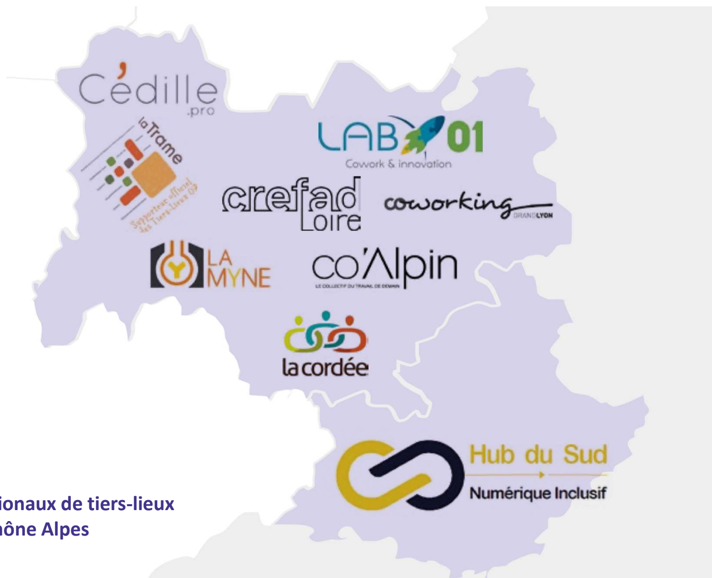
Réseaux régionaux de tiers-lieux Auvergne Rhône Alpes